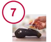
Gestion des paiements