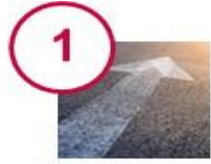
Engagement de la Direction